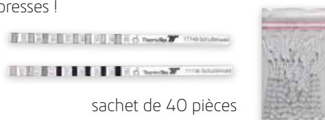
sachet de 40 pièces

Il existe différents modèles de bandelettes pour mesurer avec précision la température des presses à thermofixer. Les indicateurs changent simplement de couleur, il est donc très facile de reconnaître la température effective. Conseil : Contrôlez quotidiennement la température de vos presses !