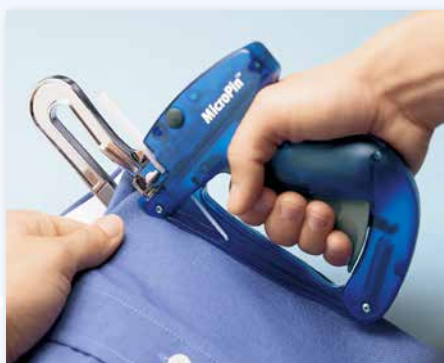
Micro Pin en application

Étiquette àagrafer en non-tissé réf. 53985