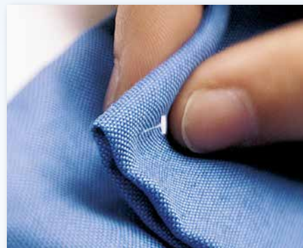
Marquage temporaire avec le Mark III Plus et le Mark III Fine Fabric