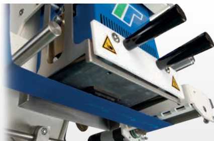
Rubans encreurs spéciaux pour marquage à chaud